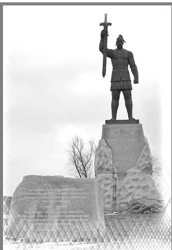
Памятник Святославу Игоревичу в Запорожье

О том, как дальше развивались события во время правления князя Владимира, вы узнаете в следующем номере.